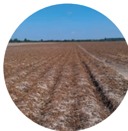
SPOTLIGHT® PLUS – ošetrený porast