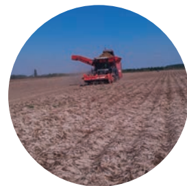
SPOTLIGHT® PLUS – následný zber